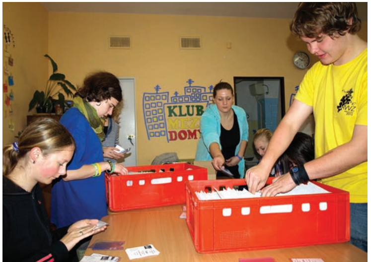
Kostka ke kostce, obálka k obálce... Jsme připraveni!