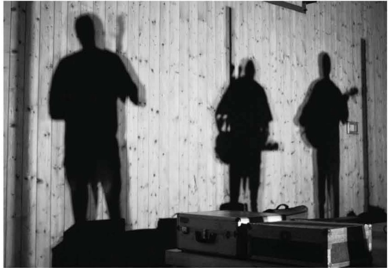
Jen tři stíny, ale těžko bys asi zapomněl na partu těchto dobrých kamarádů

Zatímco den patřil seminářům, přednáškám a workshopům, noc byla vyhrazena ceremoniálu a hudbě. O slavnostním momentu se dočtete na jiném místě Hra.ny, tady si můžete osvěžit (nebo, pokud jste tam nebyli, se dozvědět), jak vypadal koncert kapely Hop Trop, která se postarala o příjemné a zábavné zakončení dne.